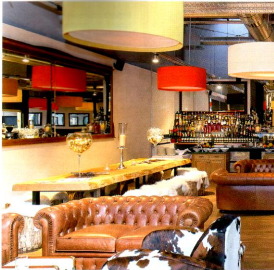
Urbane Sitzlandschaft: Der Wartesaal in Potsdam ist Bar, Restaurant und Eventlocation